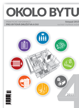
formát 170 x 230 mm

Výběr témat je ovlivňován příspěvky z diskuse na portálu Okolobytu.cz , reprezentuje proto oblasti, ve kterých je poptávka po ověřených informacích aktuálně největší.