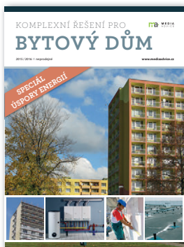
formát 170 × 230 mm

Cílem řady Komplexní řešení je poskytovat praktické informace z konkrétních, poměrně úzce vymezených oblastí bydlení. Brožury vycházejí v aktualizované podobě každý rok. V březnu je to Komplexní řešení pro bytový dům – speciál úspory energií , v září pak Komplexní řešení pro panelový dům a byt .